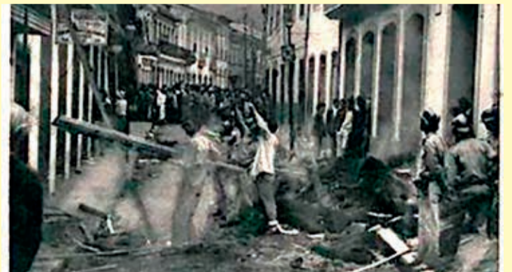
Incêndio da rua São José, 1974