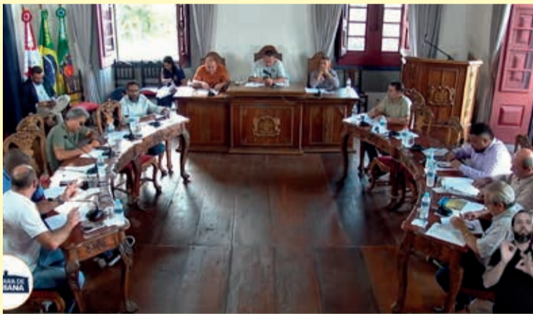
10ª reunião ordinária Câmara de Mariana

a situação das estradas vicinais, com foco nas condições enfrentadas por moradores da zona rural. Foram solicitadas informações sobre cronograma de manutenção, mapeamento de pontos críticos e disponibilidade de maquinário. As falas ressaltaram os impactos diretos das más condições das vias no transporte escolar, no acesso a serviços de saúde e no escoamento da produção rural.