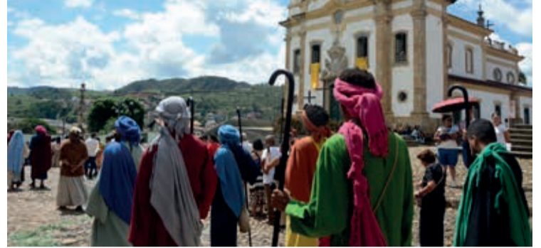
Celebrações do Domingo de Páscoa da Arquidiocese de Mariana