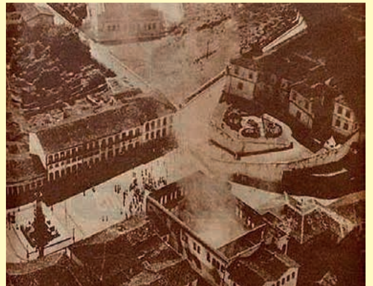
Incêndio do fórum (Não tinha FAB ainda)