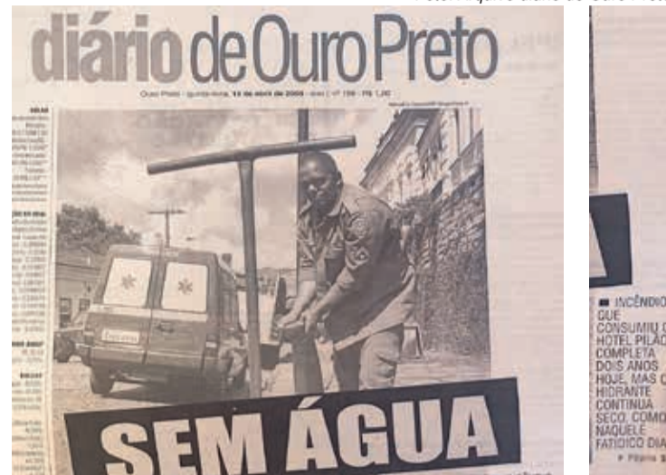
Manchete da Capa de 14 de abril de 2005: “Incêndio que consumiu o Hotel Pilão completa dois anos hoje, mas o hidrante continua seco, como naquele fatídico dia”

públicas e em matérias recentes, o incêndio do Hotel do Pilão segue como símbolo das fragilidades no combate a incêndios em Ouro Preto. Mais de duas décadas depois, a ausência de uma rede de alta pressão continua sendo apontada como um dos principais entraves para a proteção não só do patrimônio histórico, mas sim para toda a extensão do município.